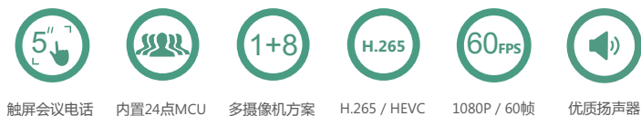
触屏会议电话 内置24点MCU 多摄像机方案 H.265 / HEVC 1080P / 60帧 优质扬声器

VC800是亿联推出的全新一代视频会议终端旗舰级产品，定位于中大型会议室。该产品具有业界最强的内置MCU，可支持24方高清视频会议，并可同时支持两个分组会议（两个虚拟会议室）；12倍光学变焦的新一代摄像机，支持1080P60帧通话，适配各种会议室环境；支持H.265/HEVC视频编码，512kbps即可实现1080P视频通话，并可抵抗高达30%的网络丢包，不花屏。采用全新一代的会议电话，内置三麦矩阵，支持长达6米的360°优质拾音距离，并配有2个有线扩展麦克风；采用优质扬声器，打造极致的声音体验。精简化的安装部署，主机与摄像机二合一，会议桌与主机之间连接只需要一条标准网线；HDMI和Mini-DP双高清辅流输入接口，适配各种电脑，支持与VCC22组成亿联所独有的1+8多摄像机方案。支持H.323/SIP双协议，深度集成于亿联视频会议服务器和亿联云管理服务平台。